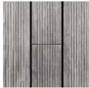
Gradation of greying of Bamboo X-trema over time: new, non-weathered decking (left), after 3 months of weathering (middle) and after 38 months of weathering (right).

דק במבוק מוסו הינו מוצר טבעי אשר מגיע בצבעים ובמרקמים מגוונים, צבעו של דק במבוק מוסו ישתנה במהלך הזמן, כמובן של"ז התחזוקה המתמדת של הדק ישפיע על הצבע שיתקבל עם חלוף השנים. לוחות הבמבוק מגיעים בצבע חום – חום כהה במועד התקנתם, צבע זה הופך לבהיר יותר עם חלוף מספר שבועות ממועד ההתקנה ונוטה לכיוון גוון הקרמל. במידה ולא תתקיים תחזוקה הקורות יקבלו מעין צל גוון אפרורי, ממש כמו כל יתר זני העצים אשר משמשים לטובת חיפוי דק. במידה ובעל הנכס מעוניין לשמר את הצבע החום, יש לבצע תחזוקה שוטפת באמצעות צבע שמן המכיל פיגמנט טיק.